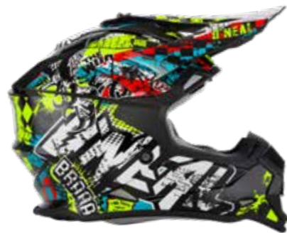
Jugend MX Helm 2SRS Wild