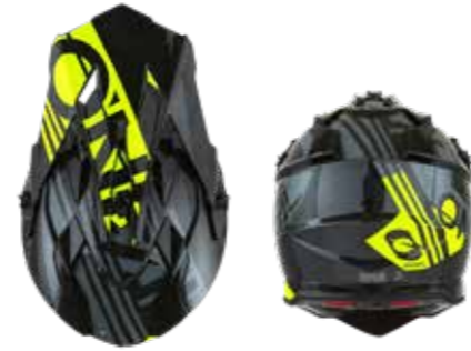
O'NEAL Jugend MX Helm 2SRS

Außenschale konstruiert aus ABS, diverse Lüftungen für optimierte Luftzirkulation, glänzendes Finish, Klarlackversiegelte Dekore in hochwertigen Farbqualitäten, gepolstertes Komfort-Innenfutter, herausnehmbar, schweißabsorbierend und waschbar, Doppel-D-Sicherheitsverschluss mit einfacher Gurtverstellung für einen perfekten individuellen Sitz, sichere Brillenbandführung durch vorgeformtes Schalendesign, höhenverstellbarer Helmschirm, Airflaps™ kompatibel, erfüllt die Sicherheitsnormen ECE 22.05