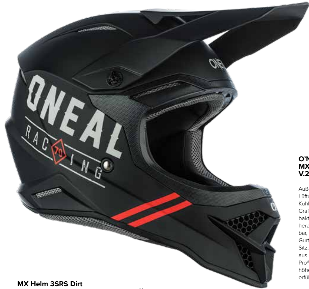
MX Helm 3SRS Dirt V.22