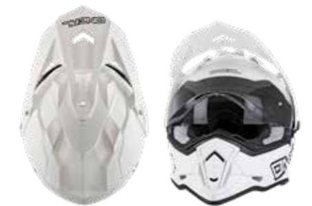
Enduro-Helm Sierra FLAT V.22 189 99

XS=53-54 S=55-56 M=57-58 L=59-60 XL=61-62 XL=63-64