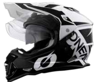
Enduro-Helm Sierra R V.22 199 99