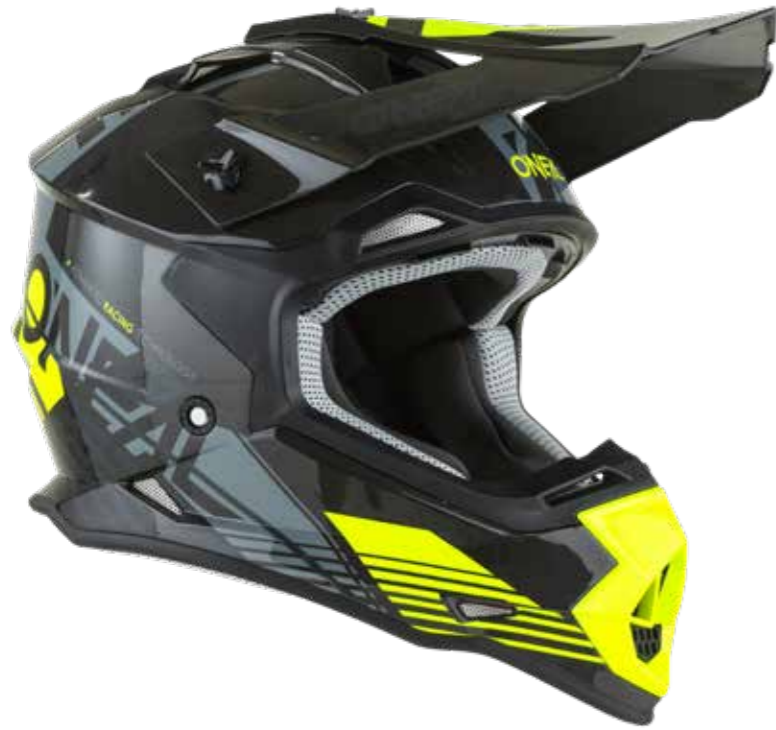
Jugend MX Helm 2SRS Rush