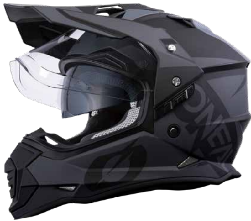
Enduro-Helm Sierra R V.22 199 99

XS=53-54 S=55-56 M=57-58 L=59-60 XL=61-62 2XL=63-64