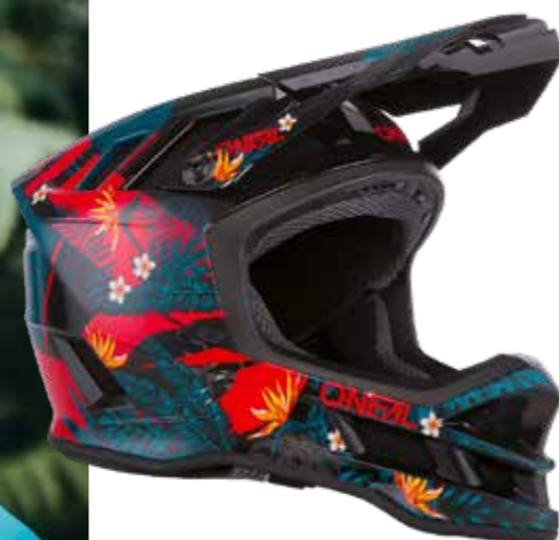
MTB Helm Blade Rio 199 99 Art. 0453-53 (red)