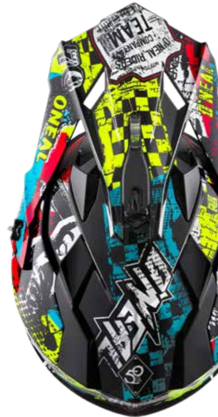
Jugend MX Helm 1SRS Rex