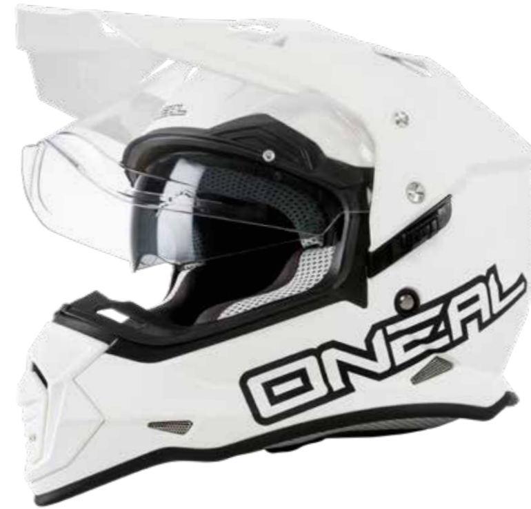
Enduro-Helm Sierra FLAT V.22 189 99

Im Vergleichstest vom Motorradmagazin „MOTORRAD“ wurde er als „Kaufempfehlung in der Kategorie Adventure- Endurohelme“ ausgezeichnet. Schale aus ABS konstruiert, mehrere Lüftungsöffnungen, glänzendes Finish. Langlebige, mehrfarbige Grafiken, ultra-plush herausnehmbares, schweißabsorbierendes und waschbares Innenfutter, Doppel-D-Sicherheitsverschluss, Pinlock® 30 Antibeschlag Linse inkludiert, klares Visier plus sekundär integrierte Sonnenblende, erfüllt die Sicherheitsnormen DOT und ECE 22.05“