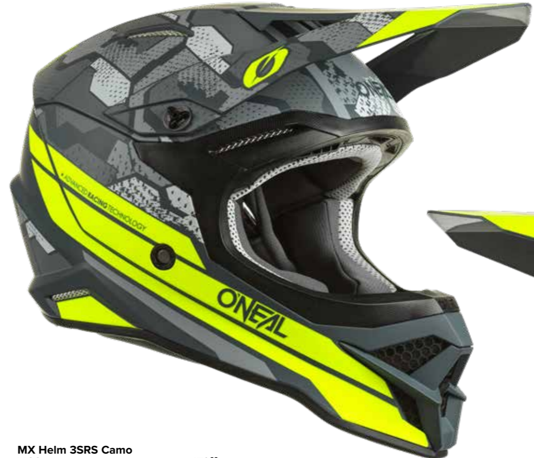
MX Helm 3SRS Camo V.22

XS-53-54 | S-55-56 | M-57-58 | L-59-60 | XL-61-62