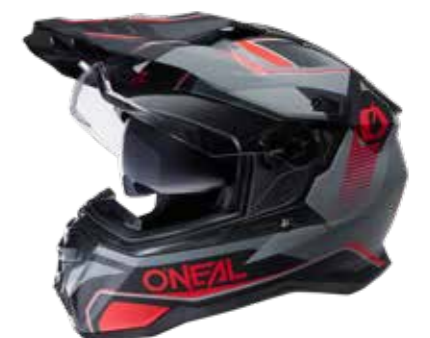
Art. DSRS-11 (black red)