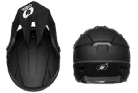
O'NEAL Jugend MX Helm 1SRS

Außenschale konstruiert aus ABS, diverse Lüftungen für optimierte Luftzirkulation, mattes (black) oder glänzendes Finish (multi), Klarlackversiegelte Dekore in hochwertigen Farbqualitäten, gepolstertes Komfort-Innenfutter, herausnehmbar, schweißabsorbierend und waschbar, Doppel-D-Sicherheitsverschluss mit einfacher Gurtverstellung, optional erhältliche break-away Visierschrauben aus Kunststoff für mehr Sicherheit, höhenverstellbarer Helmschirm, Airflaps™ kompatibel, erfüllt die Sicherheitsnormen ECE 22.05