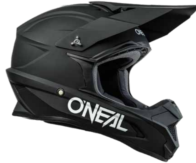
Jugend MX Helm 1SRS Solid