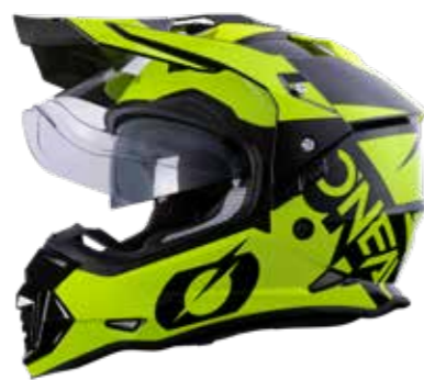
Enduro-Helm Sierra R V.22 199 99