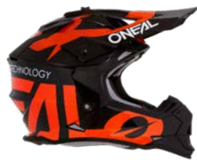
Jugend MX Helm 2SRS Slick