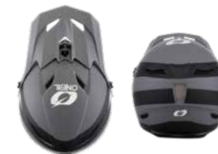
MTB Helm Fury Stage 159 99 Art. 0499-86 (black gray)