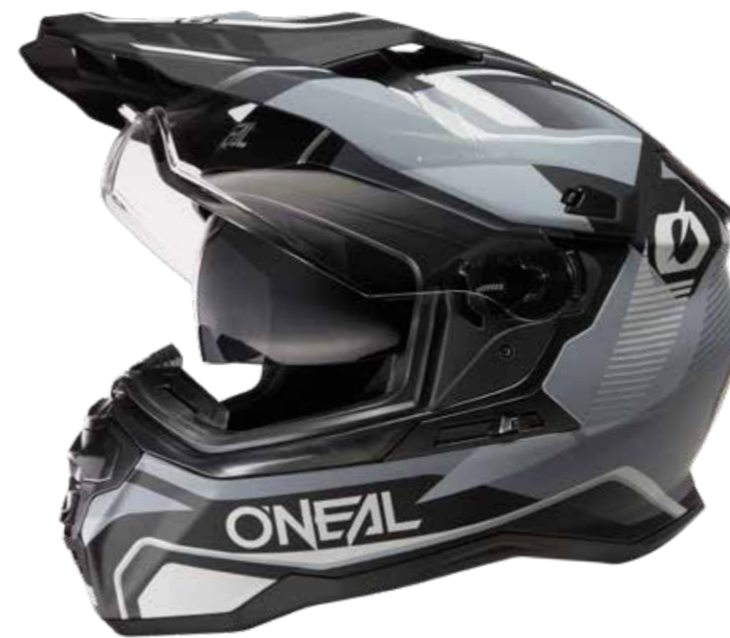
Art. DSRS-10 (black gray)